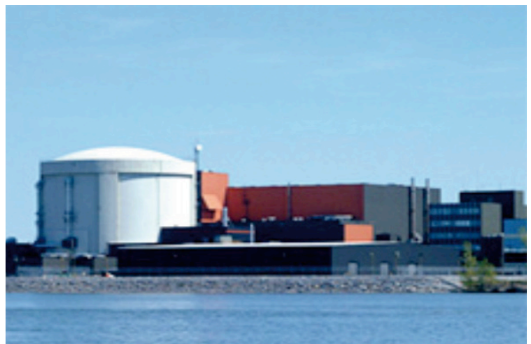
Centrale nucléaire Gentilly 2 d'Hydro-Québec