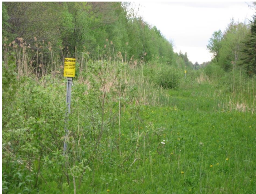
Figure 2 : Corridor du gazoduc de Gaz Métro reliant le réseau de distribution aux cavernes de Saint-Flavien. Ce corridor situé en milieu forestier est actuellement envahi par le phragmite commun. Saint-Apollinaire, mai 2014.

Les gazoducs qui traverseront les milieux boisés auront un impact particulièrement important, car ces corridors doivent en tout temps être libres d'arbres et d'arbustes créant une barrière pour nombre d'espèces forestières et deviendront une voie de pénétration des espèces généralistes et des EEE. La figure 2 illustre le corridor du gazoduc construit pour relier les cavernes de Saint-Flavien au réseau de Gaz Métro permettant d'entreposer des réserves de gaz en période de faible demande. Ce corridor est entièrement envahi par le phragmite commun malgré que ce secteur soit en milieu forestier à la limite de lots, loin des routes. Cette plante via les canaux de drainage se propagera et éventuellement rejoindra des milieux humides qui souffriront d'une forte baisse de biodiversité végétale avec des conséquences sur leur valeur écologique. D'autres plantes pourraient profiter de cette percée dans le milieu forestier et envahir le territoire. Cela pourrait être d'autant plus nuisible du fait que plusieurs de ces espèces sont presque impossibles à contrôler.